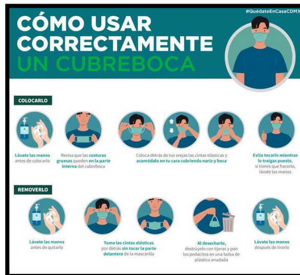
Figura 3: Uso adecuado de tapabocas.

Todos los trabajadores durante su jornada laboral deberán portar tapabocas y utilizarlo de la siguiente forma.