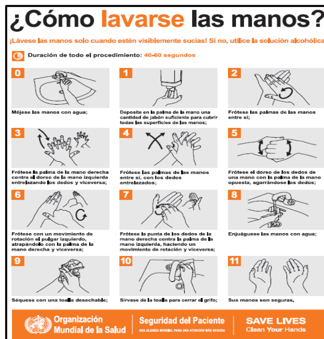
Figura 1: Protocolo lavado de manos.

Es por ello que entre los Trabajadores de la Caja de Compensación Familiar de Nariño se promueve el correcto lavado de manos haciendo uso de agua y jabón, e incluso de debe priorizar el lavado sobre la higienización de las mismas.